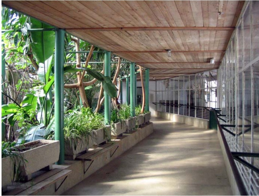
Adăpostul de iarnă al păsărilor

Cea mai spectaculoasă zonă este țarcul tigrilor, o pereche având la dispoziție cca. 2500 mp. Zona are un ochi de apă și denivelări, ceea ce lipsesc sunt elementele de îmbogățire a comportamentului.