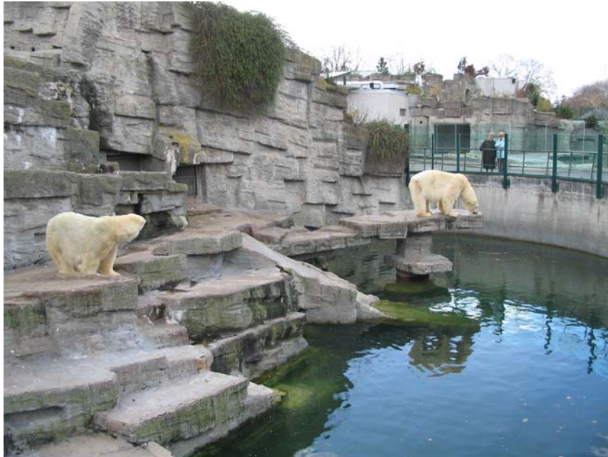
Țarc urși polari- scenografie de beton

continuarea celeilalte, din centru dau impresia de foarte mult loc. Deplasarea se poate face mult mai comod, clar, repede, vizitatorul întotdeauna știe unde se află. Acest lucru este în general valabil și mi se pare esențial în modul de utilizare al grădinii – de exemplu vegetația prea abundentă poate împiedica considerabil, așa cum am văzut la Budapesta.