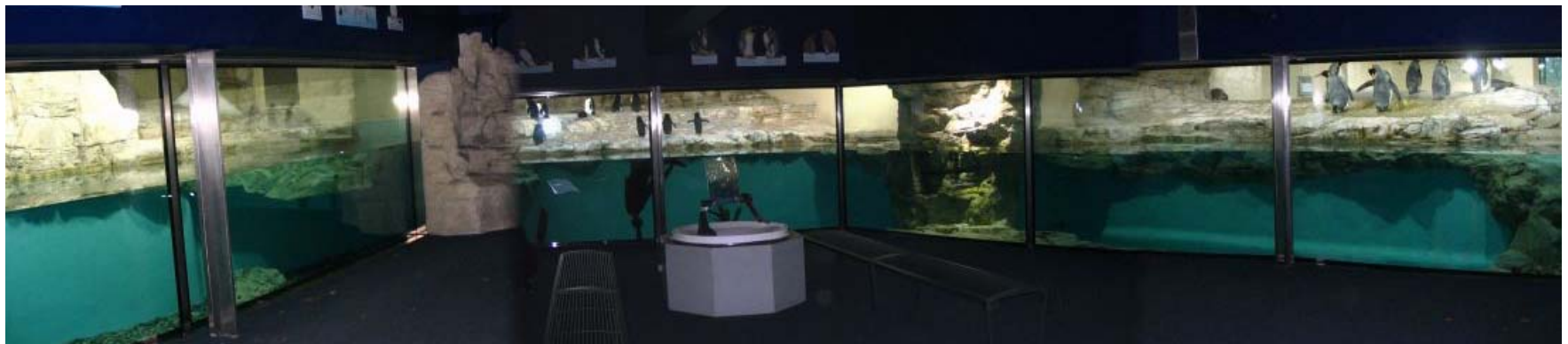
Percepție interioară subacvatică în Casa Pinguinilor

Amenajarea țărcurilor și a adăposturilor este rezolvat în așa fel, încât ele să poată fi observate din interior către interior, din interior către exterior, din exterior către interior și din exterior către exterior, de deasupra apei sub apă și invers, cu alte cuvinte vizitatorului i se oferă toate punctele de vedere posibile, pentru a surprinde animalul în toate activitățile sale. Acest sistem trebuie cuplat cu o întreținere corespunzătoare, adică amenajările să ofere animalelor posibilitatea să-și exerseze mișcările, comportamentul. Unde există, suprafețele de sticlă din interior sunt înclinate pentru a evita reflexiile neplăcute pentru animale și vizitatori – și aparatele foto.