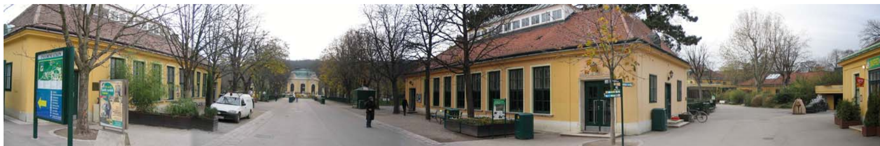
Perspectivă dinspre intrare către centrul zonei istorice

Este cea mai veche grădină modernă cu animale din lume. A fost înființată în parcul reședinței de vară a dinastiei Habsburge, lângă Palatul Schönbrunn, în 1752 1 . În 1989 era atât de deficitară, încât consiliul local și-a pus problema închiderii grădinii. În cele din urmă s-a înființat o societate pe acțiuni, care a preluat integral gestionarea financiară, proprietar rămânând consiliul local. În 1992 s-a extins cu 5 ha, ajungând la aria actuală de 17 ha 2 . Colecția cuprinde cca 390 specii și 4500 de indivizi. Numărul vizitator în 2003 a fost de 2.000.000 (50% copii), dar au avut parte de vreme frumoasă toată primăvara și vara și de două senzații: a sosit o pereche de urși panda 3 și urșii koala. Chiar și așa, grădina nu este fezabilă din punct de vedere financiar și are nevoie continuă de sponsorizări și alte surse financiare.