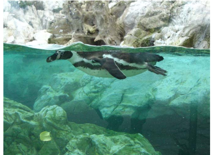
Percepție subacvatică asupra pinguinului Humboldt

Sunt foarte multe clădiri noi sau reamenajate recent, care toate dispun de tehnologii de vârf – nu doar de climatizare sau iluminat, ci și de control al traficului vizitatorilor, panouri informative etc. Este și aici un sistem unitar, coerent, foarte clar de informare, combinat cu instalații ludice, care incită curiozitatea vizitatorului – care devin exploratori, ca și animalele în medii necunoscute lor. Mi s-a atras atenția asupra importanței vizibilității pentru copii – prin barierele opace. Este interesant, clădirile vechi nu sunt la fel de dotate cu sisteme electronice ca și cele noi; evident că tehnologia expunerii nu are de suferit, însă transmiterea informațiilor și interactivitatea este mai redusă.